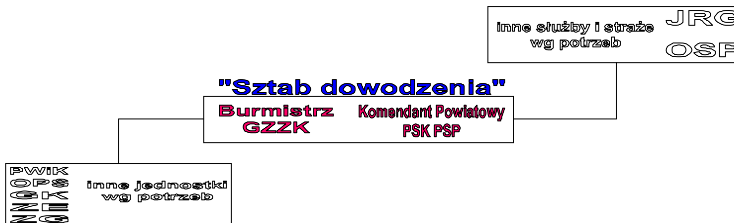
Schemat tworzenia „Sztabu dowodzenia”

Wszystkie siły uczestniczące w poszczególnych fazach zarządzania kryzysowego zobowiązane są do ścisłego współdziałania w celu jak najbardziej efektywnego realizowania zadań mających na celu ochronę ludności i mienia. Organem koordynującym te działania jest na terenie gminy Burmistrz, komendant gminnego OSP lub najwyższy funkcją lub stopniem strażak z OSP lub PSP. Podstawa prawna takiego systemu to art.14 ustawy o ochronie przeciwpożarowej z 24. 8.1991 r. (Dz.U. nr 178, poz. 1380 z 2009 r z póź. zm.) oraz art. 19 ustawy o zarządzaniu kryzysowym z 26.4.2007 r (Dz.U. Nr 89, poz. 590 z 2007 r z póź. zm.). Jednakże trzeba zwrócić uwagę na konieczność położenia nacisku na merytoryczną stronę zagrożenia i konieczność wypracowywania decyzji do dalszych działań przez elementy organizacyjne właściwe merytorycznie do danego zdarzenia. Powinno to być realizowane przez tworzenie „sztabów dowodzenia” czyli GZZK poszerzonego o odpowiednie do zaistniałej sytuacji osoby funkcyjne instytucji, służb, straży itd. W przypadkach doraźnych tworzenie „sztabów dowodzenia” będzie realizowane przez PSP w ramach PSK. Dlatego też niekiedy nie burmistrz czy strażak będzie „dowodził” ale osoba najbardziej merytorycznie przygotowana przygotowuje decyzje do realizacji – zaplanuje działania.